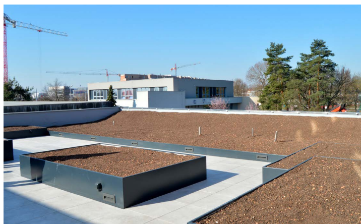
Snímky jsou pořízeny před posledními stavebními úpravami.