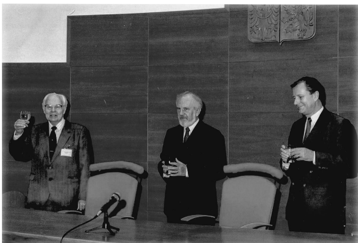
SOUDNÍ SÍŇ. Kruhový sál – rotunda, někdejší Kabinet dějin KSČ, byla z iniciativy děkana Miroslava Liberdy přestavěna na soudní síň pro simulované soudní procesy, první svého druhu v České republice. Slavnostního otevření se uskutečnilo na podzim 1996.