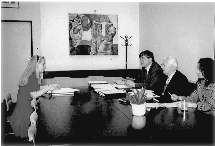
ABSOLVENTI. Na obhajoby diplomových prací i státní zkoušky často dohlížel i děkan Miroslav Liberda.