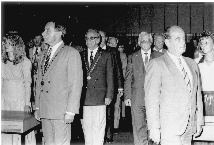
ZAHAJUJEME. U příležitosti zahájení činnosti obnovené právnické fakulty se konalo v září 1991 slavnostní shromáždění v aule.