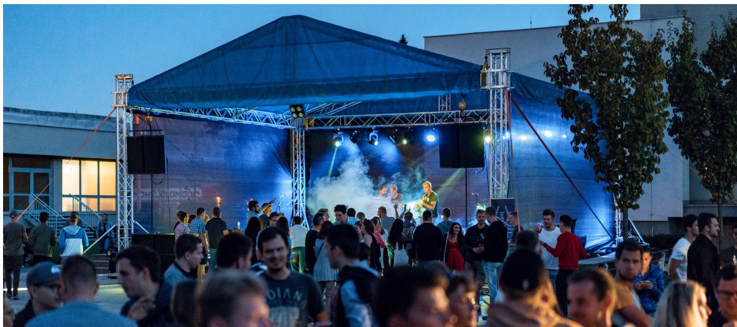
ZAHAJOVACÍ PÁRTY. Studentské spolky Nugis Finem a ELSA Olomouc spolu s právnickou fakultou připravily párty u příležitosti zahájení nového akademického roku – Vokno před fakultou II. Foto: Petr Pavlica (více fotografií na fakultním facebooku )

Síť partnerských univerzit se snažíme dál rozšiřovat, a to jak pro studentskou, tak i pro učitelskou mobilitu. Prioritou je kvalita univerzity, tedy zejména nabídka kurzů a zázemí pro studenty a potenciál pro vědecko-výzkumnou spolupráci pro akademiky. Mezi partnerské univerzity přibude Univerzita Karlová Stefana Wyszyńskiego ve Varšavě, rýsuje se spolupráce s univerzitami v Jižní Americe a na Novém Zélandu. Vědomi si finanční náročnosti těchto destinací, snažíme se rovněž získávat zdroje. V tomto roce se nám tak podařilo získat takzvanou kreditovou mobilitu v rámci programu Erasmus+ pro spolupráci s Jihoafrickou republikou.