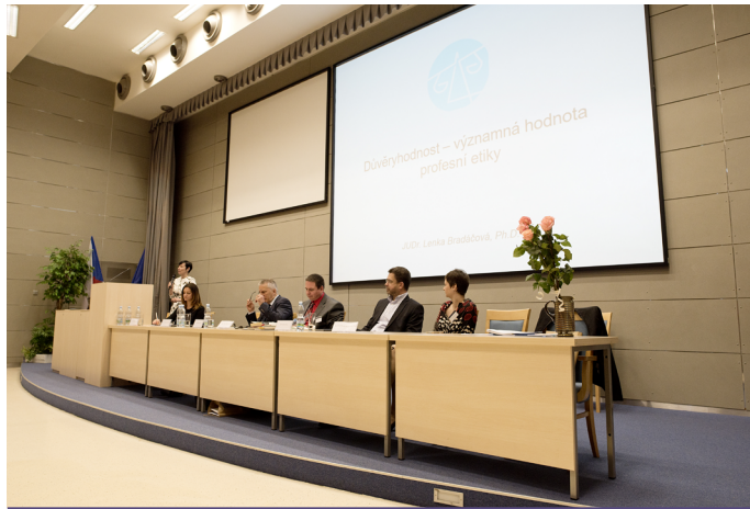
OLOMOUCKÉ PRÁVNICKÉ DNY. Mezinárodní vědecká konference Olomoucké právnické dny představuje nejvýznamnější událost, která se v oblasti vědeckého života na půdě olomoucké právnické fakulty každoročně koná. První ročník se uskutečnil v roce 2007, na snímku rok 2018. Vloni tradici přerušila epidemie koronaviru.