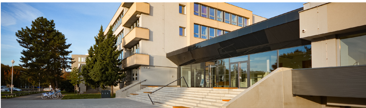
DOSTAVBA. Hrubá stavba nového centrální křídla fakulty trvala rok a čtvrt. Teď se nové prostory – knihovna, studijní centrum a zázemí Centra pro klinické právní vzdělávání dovybavují nábytkem.