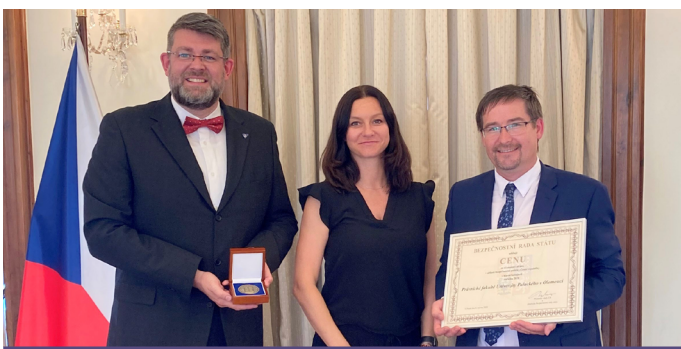
CENA PRO FAKULTU. Zástupci fakulty převzali Cenu bezpečnostní rady státu za významný přínos v oblasti bezpečnostní politiky ČR pro rok 2020. Bezpečnostní rada státu tak ocenila dlouhodobou a progresivní práci fakulty v otázkách bezpečnosti a v oblasti mezinárodního humanitárního a operačního práva.