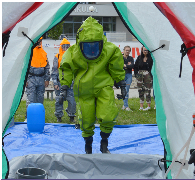
LETNÍ ŠKOLA. Zatím poslední Letní škola medicínského práva se konala v roce 2019. Byl to její pátý ročník. Vloni tradiční akci přerušila epidemie koronaviru.