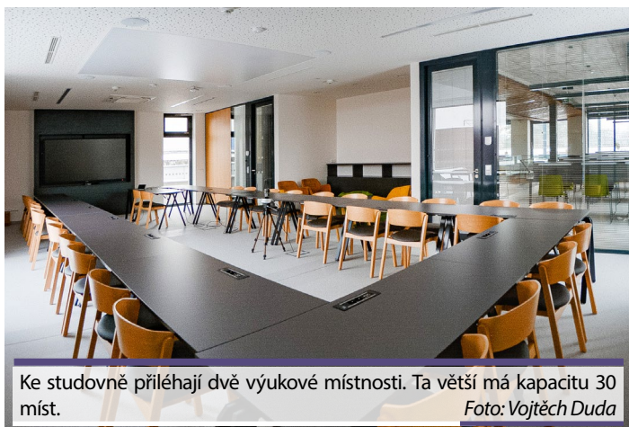
Ke studovně přiléhají dvě výukové místnosti. Ta větší má kapacitu 30 míst.

BV: Doufáme, že třeba na podzim bychom něco takového uspořádali. Uvidíme, jak se bude situace kolem epidemie vyvíjet. To místo si to zaslouží.