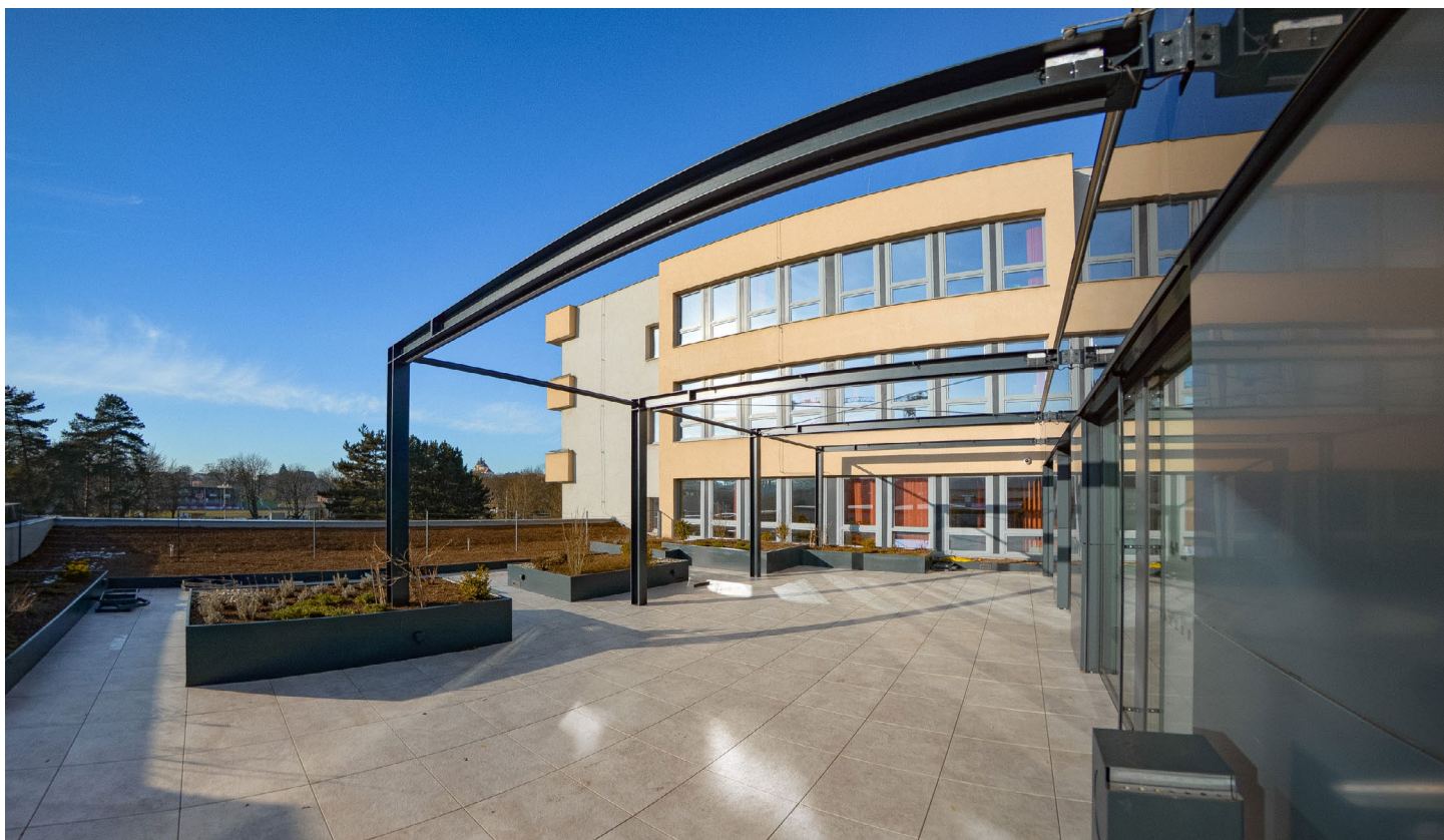
Terasa bude zastíněná lehkými plachtami, budou tam lavičky a také sedací vaky.