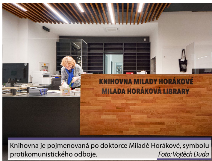
Knihovna je pojmenovaná po doktorky Miladě Horákové, symbolu protikomunistického odboje.

MF: Milada Horáková sice není přímo napojená na fakultu či na Olomouc, avšak pro nás je zásadní její odkaz. Už při obnovení v roce 1991 dostala naše fakulta do vínku hodnoty jako je svoboda, demokracie, lidská práva a občanská společnost. Na nich stavíme a prosazujeme je, vnášíme je do výuky. Proto to propojení s doktorkou Miladou Horákovou.