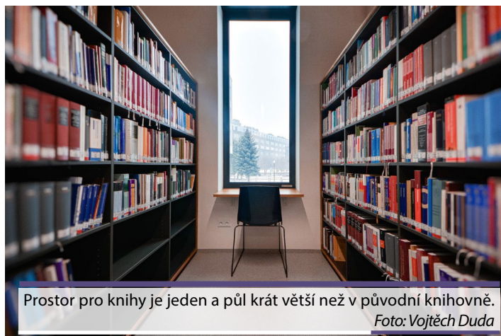
Prostor pro knihy je jeden a půl krát větší než v původní knihovně.

MF: Zpočátku jsme se chodili na stavbu jen dívat. Až v létě 2019, kdy se začaly objevovat první těžkosti, nás tehdejší děkanka Zdenka Papoušková pověřila dohledem nad stavbou. Srpen 2019 jsme tam strávili téměř celý, hrozilo