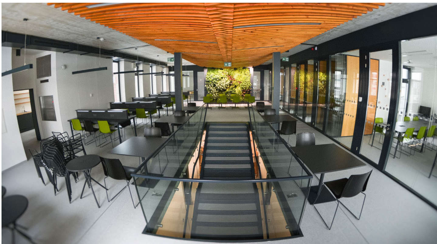
Studovnu zdobí květinová stěna.

BV: To v současné době intenzivně řešíme. Připravují se analýzy, které nám ukážou, na co bude prostor ideální, na co bychom jej mohli využít. Těch variant je několik. V tuto chvíli je brzy to konkretizovat.