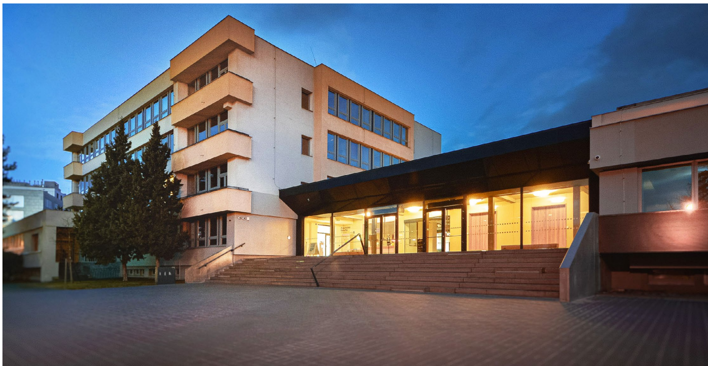
Do venkovního schodiště jsou zajímavě zakomponovaná místa k sezení, takové netradiční lavičky.